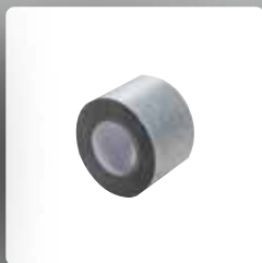
mira iseliimuv lint vuukide tihendamiseks