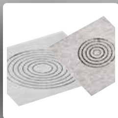
mira mansetid läbiviikude tihendamiseks

Baasmaterjali XPS kärje täitegaasiks on õhk.